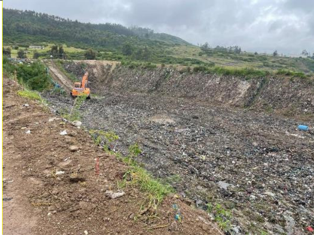
Construcción planta de tratamiento de lixiviados del Contrato Nro. EMGIRS-EP-GGE-CJU-2021-018.